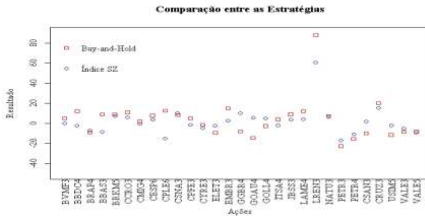
Figura 1: Comparação entre as Estratégias S-Z e B-H

A incidência de despesas decorrentes das operações de compra e vendas de ações impacta a lucratividade das estratégias de investimento. Isso é constatado na tabela 5, em que os resultados, após considerarem-se os custos de transação, se mostraram inferiores ao cenário em que estes não foram incorporados nas operações.